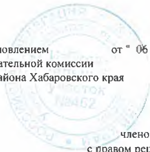
ГРАФИК РАБОТЫ членов участковой избирательной комиссии № 462 Аяно-Майского района с правом решающего голоса, работающих в комиссии не на постоянной (штатной) основе на выборах депутатов Государственной Думы Федерального Собрания Российской Федерации восьмого созыва на Сентябрь 2021 года

Утвержден постановлением от "06" Сентября 2021 года № 1 участковой избирательной комиссии Аяно-Майского района Хабаровского края