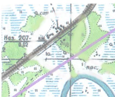
Казарма 207 км.