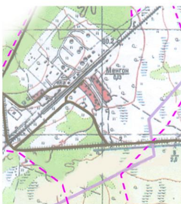
пос. ст. Менгон